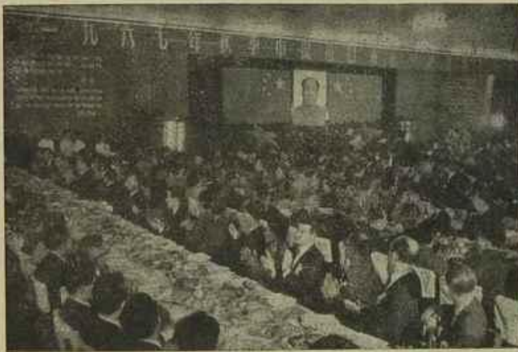
Nahore: Více než 3000 hostů z pěti světadílů, zúčastněných na recepci a příležitosti zahájení veletrhu výpozního zboží v Číně 1967. ● Dole: Dvě třetiny strojírenských výrobků, vystavovaných na veletrhu, jsou novými anebo podstatně v průběhu kulturní revoluce zlepšenými výrobky.

Chápání a aplikování Mao Ce-tungova myšlení lidem dosahuje nového vrcholu zvláště v revoluční masové kritice, která se uskutečňuje po celé Číně. Aktivní účast na schůzích, kde se kritizuje, a psaní ta c'pao dává miliónům čínského lidu příležitost stále hlubšího chápání toho, co je proletářská revoluční linie předsedy Mao a co je buržoazní reakční linie; co je socialistická cesta a co je kapitalistická cesta; co je marxismus-leninismus, Mao Ce-tungovo myšlení a co je revizionismus. Dnes má čínský lid daleko větší schopnost rozpoznat revizionismus a bránit se mu. Čína nyní buduje pevnou masovou základnu boje proti revizionismu. V procesu přeměny vnějšího světa Mao Ce-tungovým myšlením revoluční masy užívají rovněž této nejostřejší ideologické zbraně, aby provedly revoluci v hloubi svého vlastního nitra. Usilovně pracují na tom, aby se osvobodily od vlivu egoismu — jenž byl po tisíce let ideologií vykořisťovatelských tříd — snaží se stát se lidmi plně oddanými prospěchu celku. Ve velkém počtu rostli komunističtí bojovníci, oddaní do hloubi srdcí veřejným zájmům — lidé jako Čaj Jung-siang, který obětoval život při záchraně rudých gardistů, a Nien Su-wang, který byl vážně zraněn, když se mu podařilo zabránit vykojení osobního vlaku.