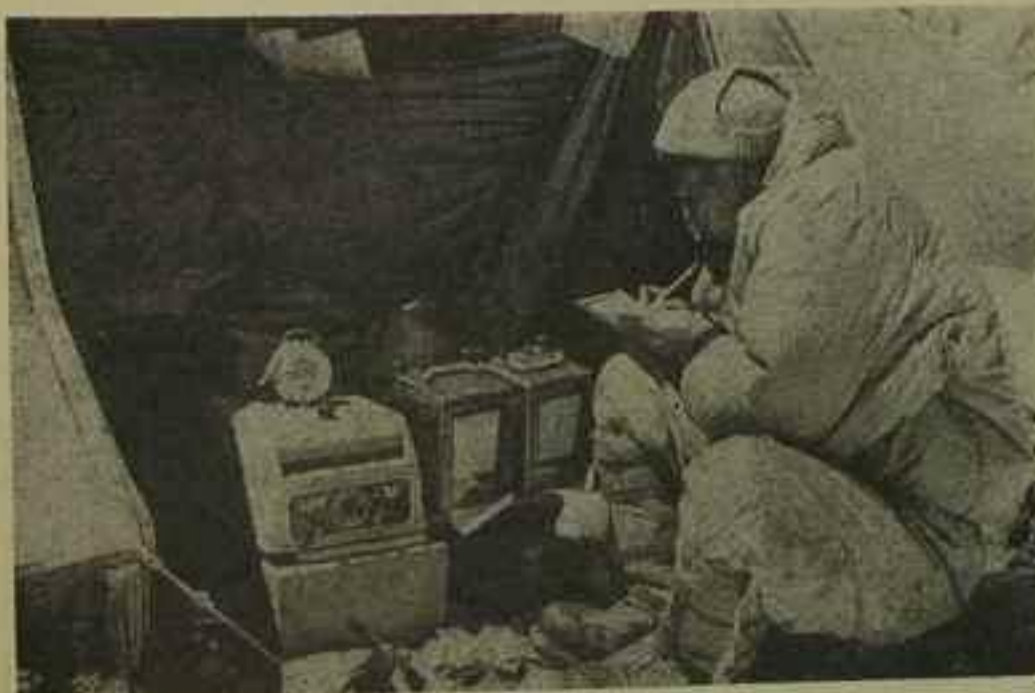
Naši vědečtí badatelé ve výšce 6300 m nad mořem studují a proměřují zákony sluneční radlance.

K Mezinárodnímu dni práce roku 1967 byla vydána série osmi pamětních známek nazvaná „Ať žije předseda Mao, náš velký učitel, velký vůdce, velký vrchní velitel a velký kormidelník!“