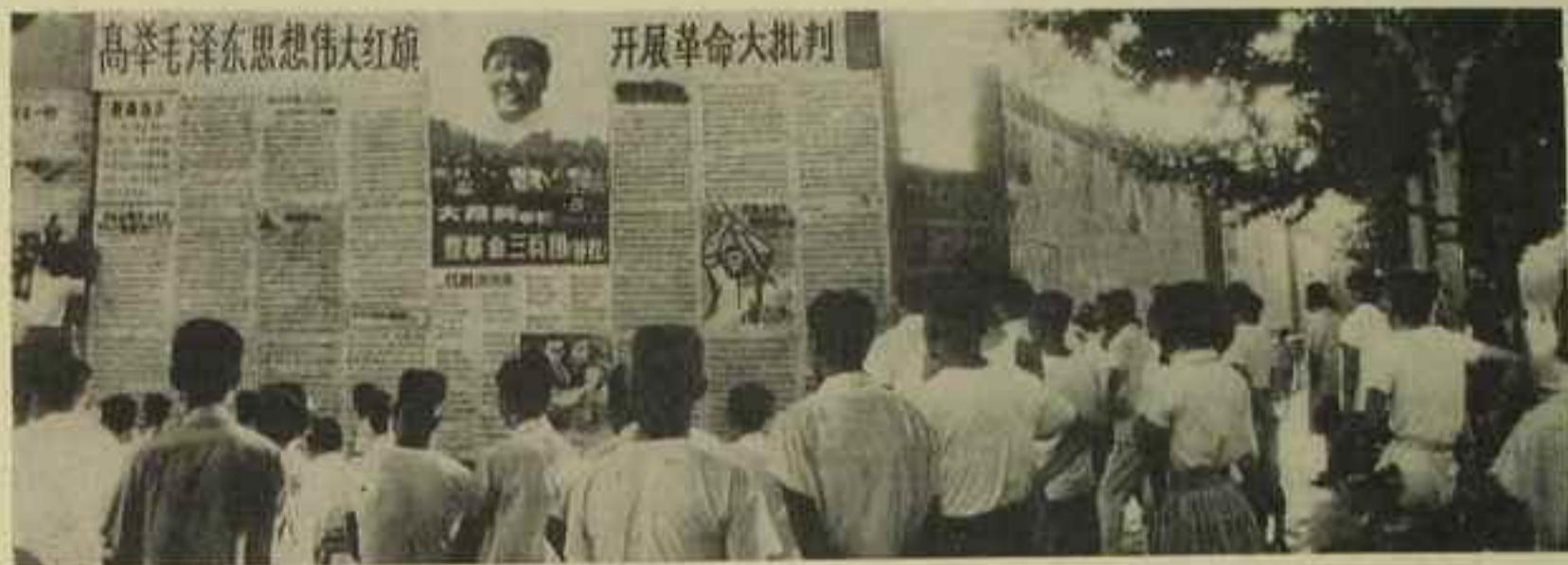
Nový vzestup revoluční kritiky kontrarevoluční revizionistické linie.