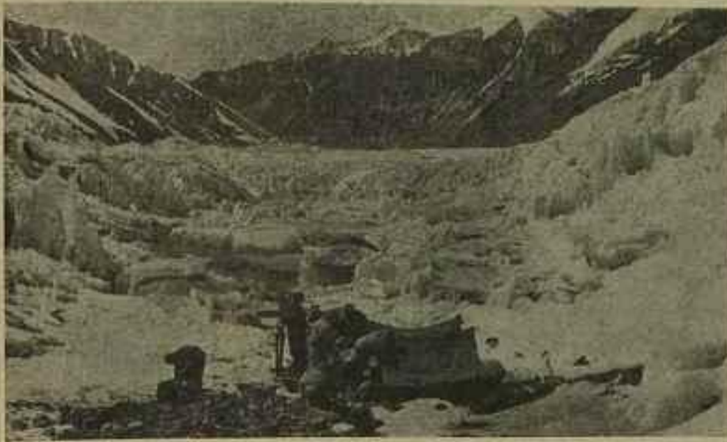
Naši vědečtí pracovníci v boji za poznání přírody v oblasti Ču-mu-lang-ma ve výšce 5100 m nad mořem.

V roce 1966 a 1967 byla sestavena rozsáhlá komplexní badatelská jednotka z organizací Čínské akademie věd, z 23 vědeckých jednotek vysokoškolských, jednotek průmyslových odvětví a z organizací vědeckého studia při Čínské lidové osvobozené armádě. V oblasti hory Ču-mu-lang-ma (t. j. na jih od řeky Ja-lu-cang-pu v prostoru 50.000 km 2 , východně od Yatungu až na západ ke Kyirongu) bylo prováděno všestranné a soustavné komplexní bádání a získaly se četné velmi vzácné materiály o horách Himalaje a Ču-mu-lang-ma; objevy dosvědčily, jak se přeměnilo moře ve vysoké hory a vytyčily spolehlivé vědecké argumenty pro výstavbu socialismu a použití přírodních surovin v Tibetu.