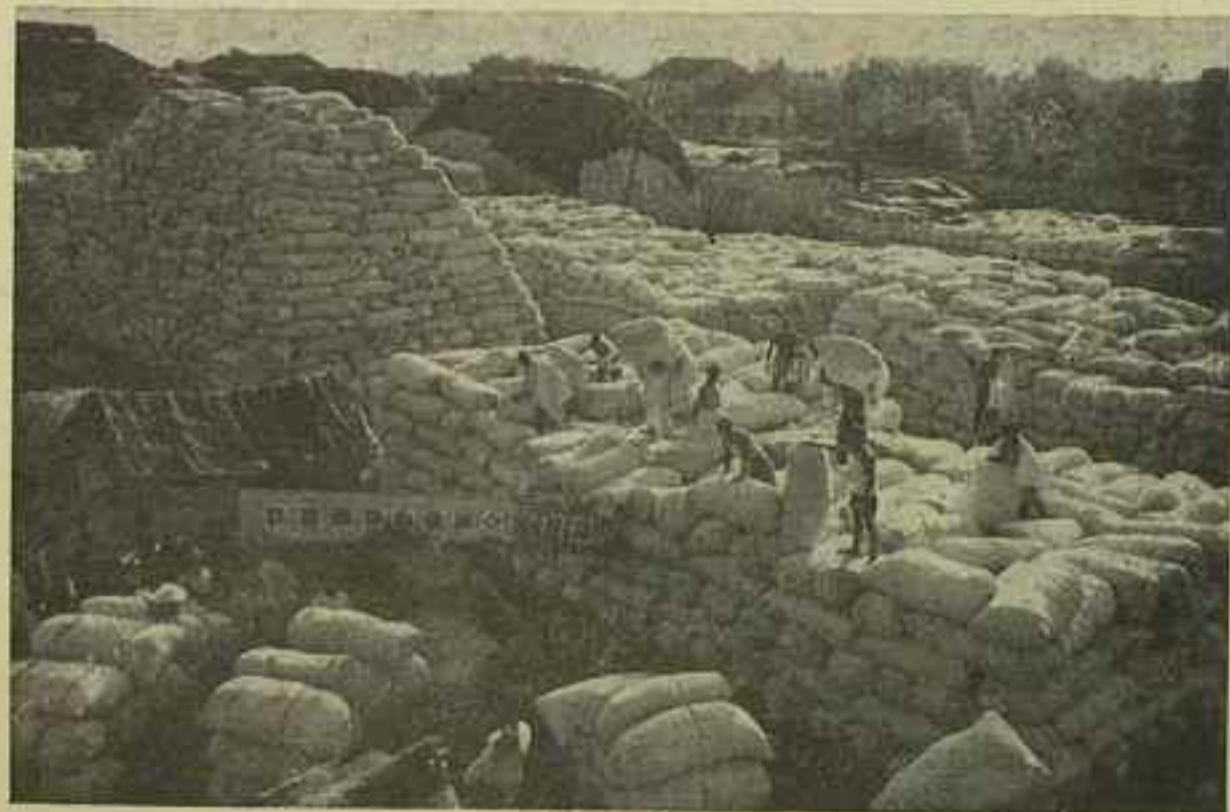
Sklizba bavlny byla v roce 1967 mnohem vyšší než rekord dosažený v roce 1966.